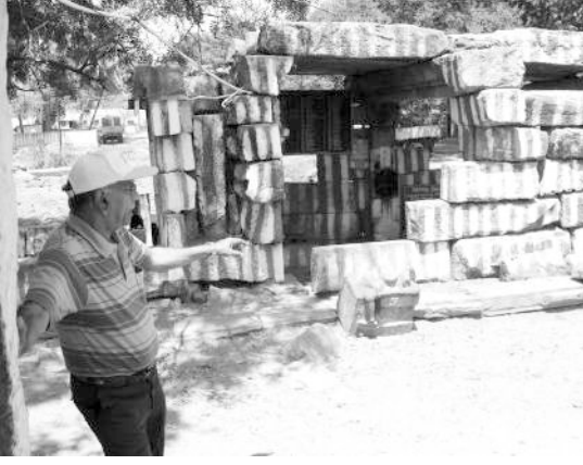
வெறும் எனும்புக் கூடாய் - கற்றளி கட்டிட மாதிரி

என்கிறான் இந்த மன்னன்! எத்தனை கர்வமற்று, உயர்ந்த இறை சிந்தையையோடு அவன் இருந்திருக்க வேண்டும்?