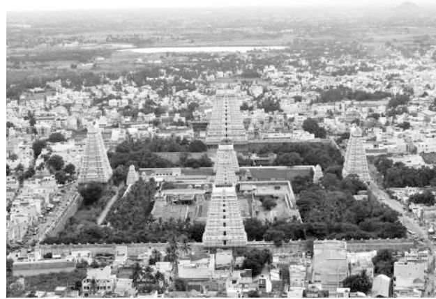
Areal View of Thiruvannamalai Temple

As far as Sangam literatures is concerned, Thiruvannamalai is mentioned in Akanaanuru and Natrinai. Thirugnana Sambandar (Thevaram), Thirunavukkarasar (Thevaram), Sekkizhar (Periyapuram) and Ramalinga Swamigal (Thiruvartpa) sung hymns on Thiruvannamalai. More than 60 Sthal Purans are available in Tamil, and in Sanskrit we have Arunachala Stotras and Arunachala Ashtakam.