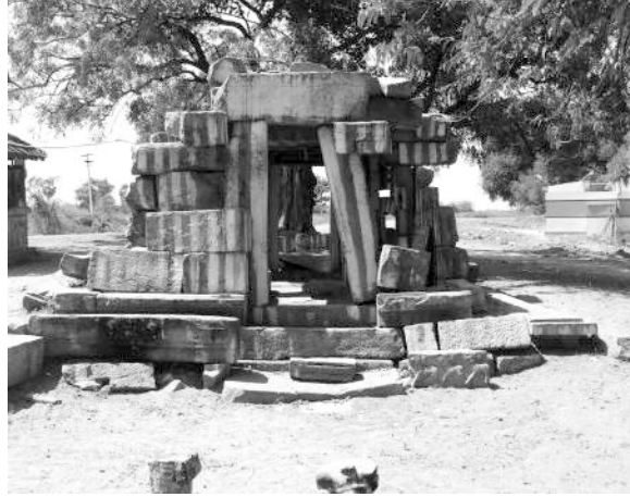
சக்குடி சிவன் கோவில்

மறுபுறம் உடைந்த நிலையில் சண்முகர். கற்றளியைத் தோண்டிப் பார்க்கையில், சுமார் 7 அடி உள்ளே புதைந்து போயுள்ளதாகத் தெரிகிறது. குறுக்கே ஓடும் மண்பாதையும் நீர் நிலைக் கரையும் சமீபத்தியவை என்று கிராமத்தினர் ஒப்புக் கொள்கின்றனர். இரண்டு கற்குவியல்களே இரு சன்னதிகள். அழகிய நந்தியும், அதன் பின்னே பாதி தரையில் மூழ்கிய நிலையில் அரசன் உருவம் தாங்கிய ஒரு கல்வெட்டும் கண்டோம். 1314ஆம் நூற்றாண்டு கல்வெட்டு அது. மக்கள் கைதூக்கி அதனை வெளியே எடுத்தனர். அது உடனடியாக சுத்தம் செய்யப்பட்டு, நேராக நிமிர்த்தி வைக்கப்பட்டது. ”...றை தருவார் திருவடி என் தலை மேலே ...”, அதாவது கோயில் பணி செய்யும் அடியாரின் திருவடிகளை என் சிரசில் தாங்குகிறேன்