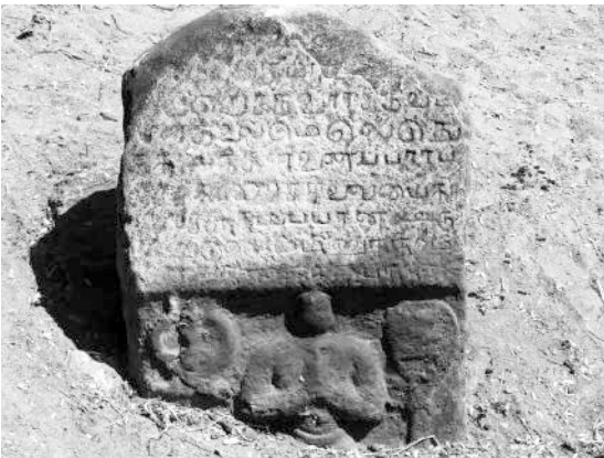
கூப்பிய கரங்களுடன் கல்வெட்டு!

இந்த செய்கையில், ரீச்சின் கனவுகள் நனவாகின! ஆம். RURAL EDUCATION AND CONSERVATION OF HERITAGE என்பதின் சுருக்கமே REACH. அதாவது, கிராம மக்களுக்கு விழிப்புணர்வு ஏற்படுத்தினாலேயே, புராதன சின்னங்களை நாம் காக்க முடியும் என்பது இங்கு நிரூபணம் ஆகிவிட்டதல்லவா? முன்பு வெறும் கல்லாய் இருந்தது, இன்று அப்பகுதியை ஆண்ட மன்னனின் கல்வெட்டுச்செய்தி என்பதறிந்த மக்கள் உடனடியாக சுத்தம் செய்து, அதனை தூக்கி நிறுத்தி வைத்து விட்டார்களே!